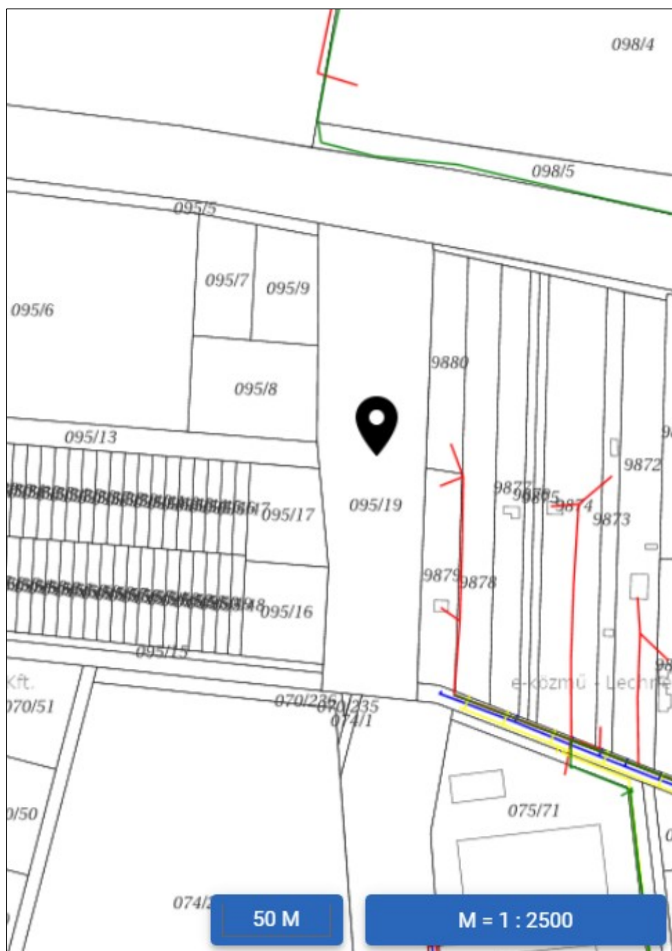
E-közmű térkép 095/19 hrsz