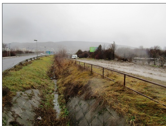
095/80 hrsz közterület