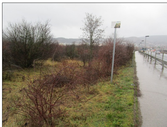
095/76 hrsz közterület