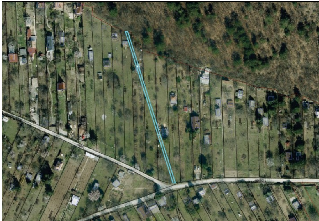
8880 hrsz ortofotó