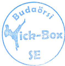
Budaörsi Kick-Box SE