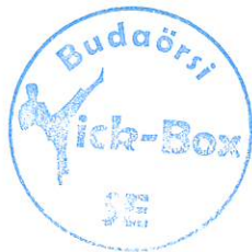
Budaörsi Kick-Box SE