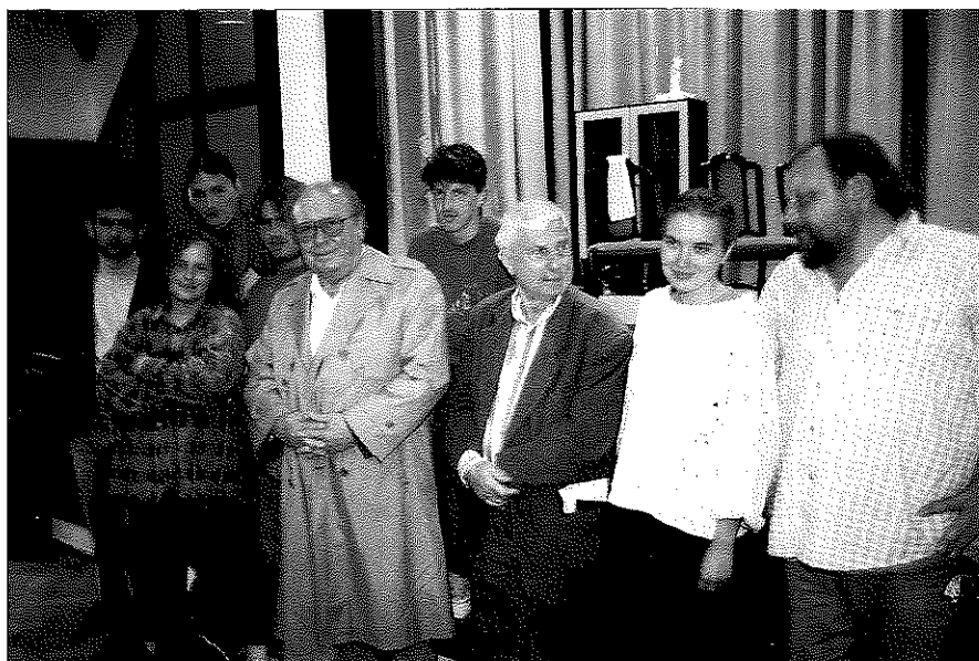
A Komédiás Kör próbáját két Kossuth-díjas művész is meglátogatta, Kállai Ferenc, Gyomaendrőd díszpolgára és Bacsó Péter filmrendező