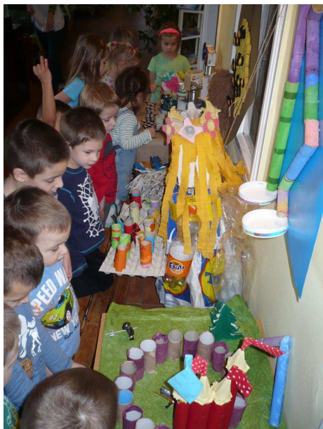
„Európai hulladékcsökkentési hét”