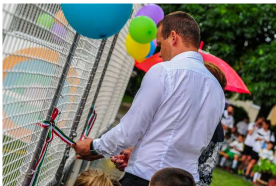
Gyermeknap motoros felvonulás